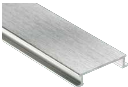
Schlüter®-DESIGNLINE-AGBE anodizado escovado (-ACGB)