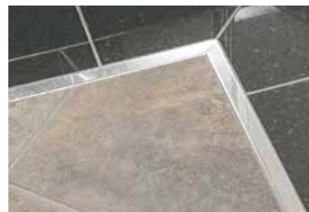
Schlüter®-DESIGNLINE-E na área do pavimento