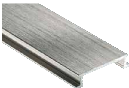
Schlüter®-DESIGNLINE-AGBE anodizado escovado (-ATGB)

DESIGNLINE-E é moldado a partir de fitas de aço inoxidável em V2A (material 1.4301 = AISI 304). O aço inoxidável é especialmente indicado para aplicações que, para além de uma elevada capacidade de sobrecarga mecânica, exijam também uma resistência contra solicitações químicas, provocadas, por exemplo, por substâncias ácidas ou alcalinas ou produtos de limpeza. Mas também o aço inoxidável não é resistente a todas as agressões químicas, como ácido clorídrico e fluorídrico ou a determinadas concentrações de cloro e salmoura. Isto também se aplica, em determinados casos, a piscinas de água salgada. Por esse motivo, as esperadas solicitações especiais devem ser verificadas de antemão.