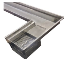
canto e saída sifonada