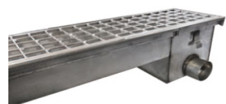
saída sifonada horizontal