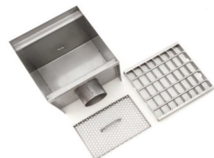
caixa de limpeza com ou sem sifão com cesto de resíduos e com saída vertical ou horizontal