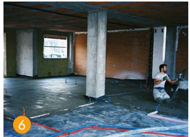
Estender Selar sobreposição sobreposição vertical Proteger instalações verificar verter a argamassa